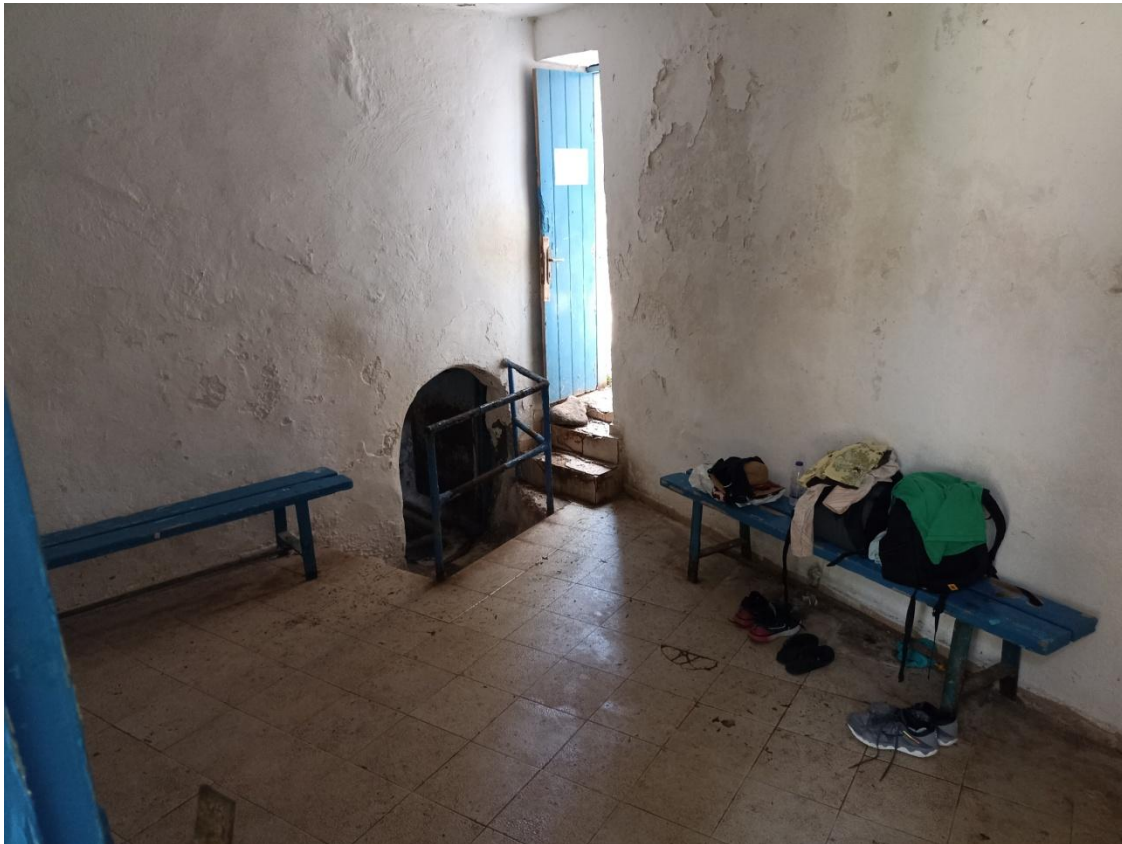
Ο προθάλαμος του οθωμανικού λουτρού