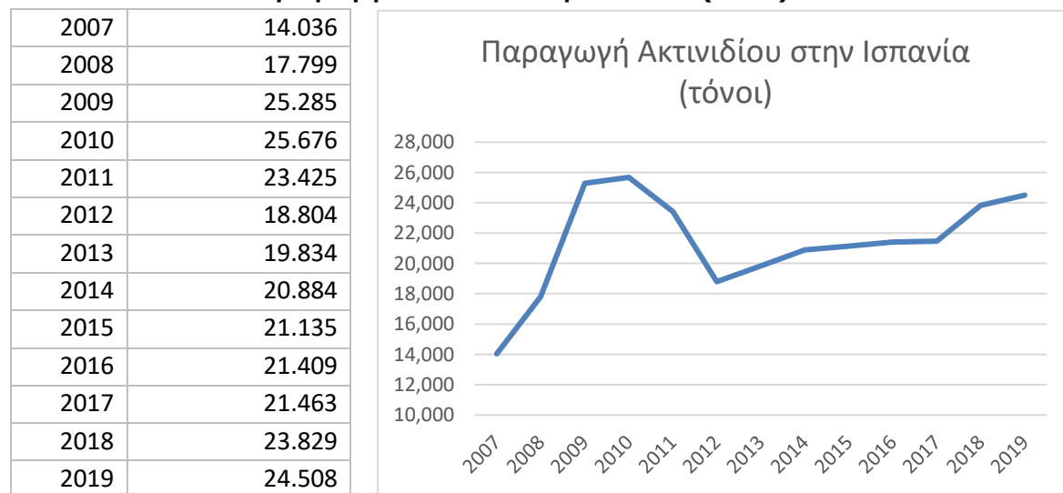
Παραγωγή Ακτινιδίου στην Ισπανία (τόνοι)

Πηγή: Υπουργείο Γεωργίας, Αλιείας και Τροφίμων (ΜΑΡΑ)